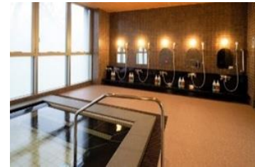
入浴施設(浴場)のイメージ

また、配置計画は工場棟とは別棟とし、管理事務所・見学者施設と合棟とする計画です。