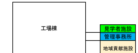
施設配置のイメージ図